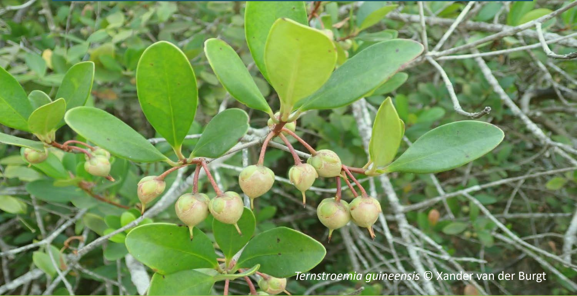
Ternstroemia guineensis