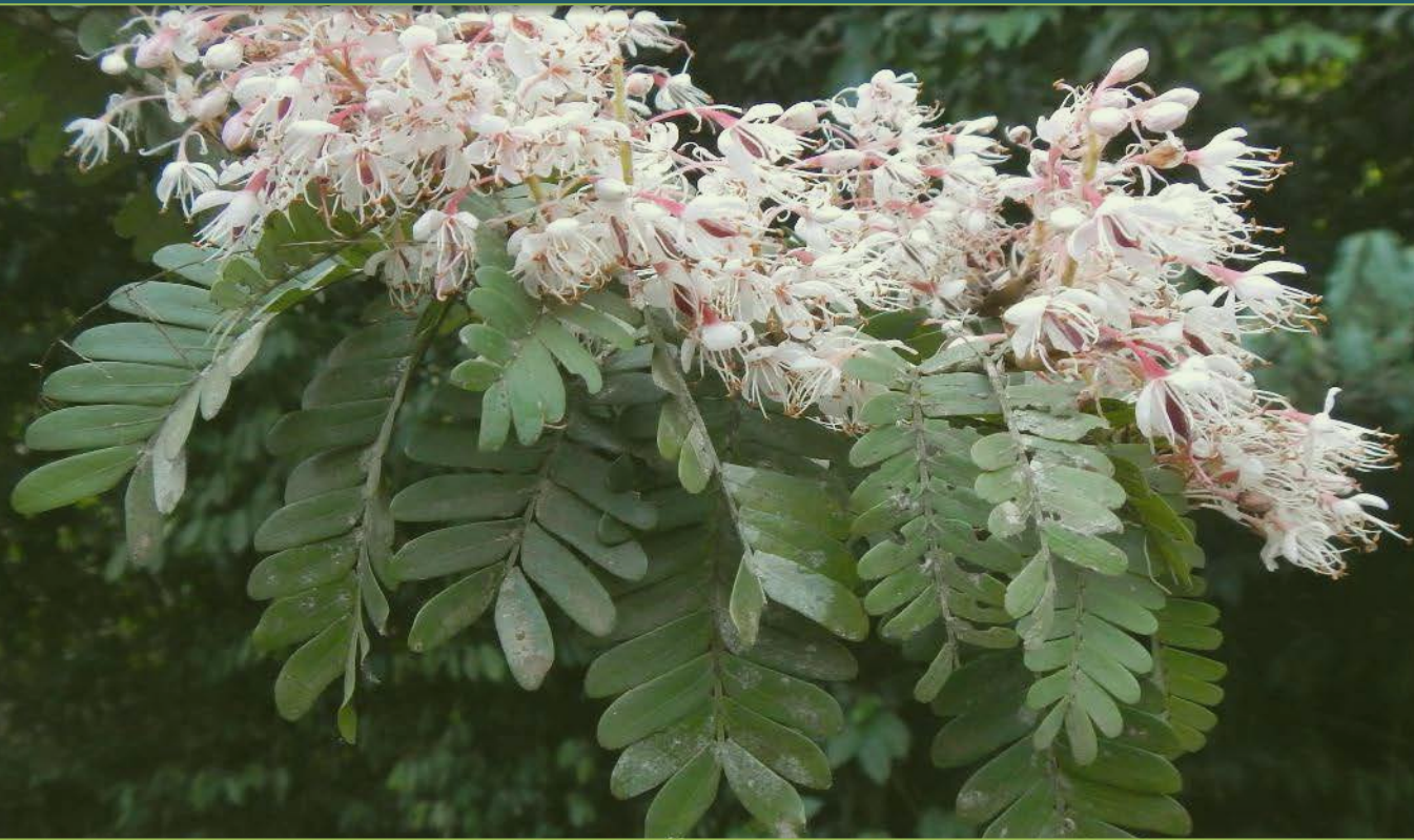
Talbotiella cheekii

Projet de Conservation des arbres menacés dans trois Zones Tropicales Importantes pour les Plantes (ZTIPs) en Guinée , financé par le Fondation Franklinia