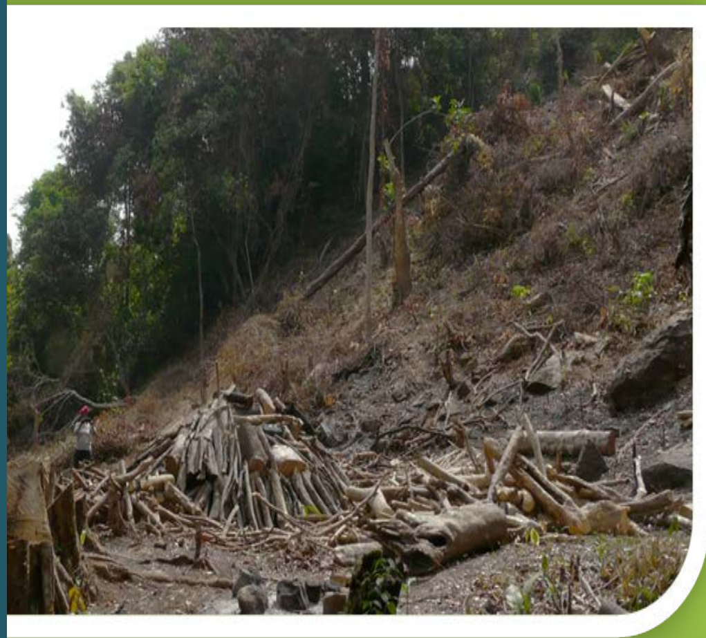
Destruction de la forêt à Pont Kaka 2019