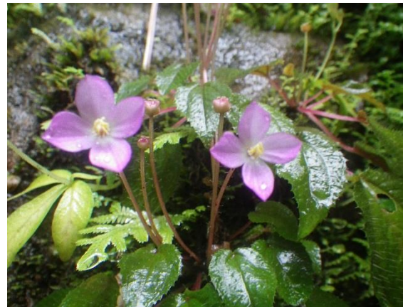
Cincinnobotrys felicis (A.Chev.) Jacq.-Fél