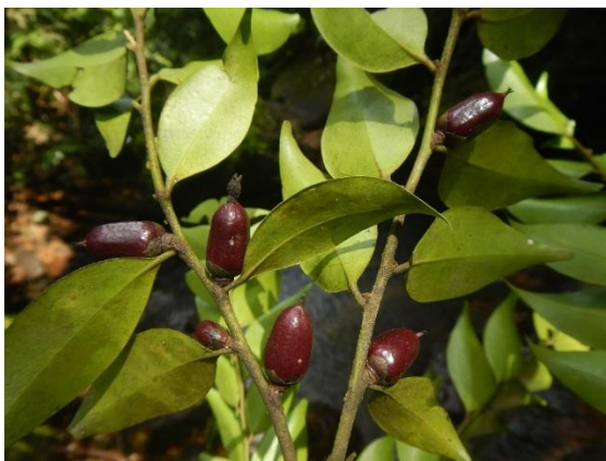
Diospyros feliciana Letouzey & F.White