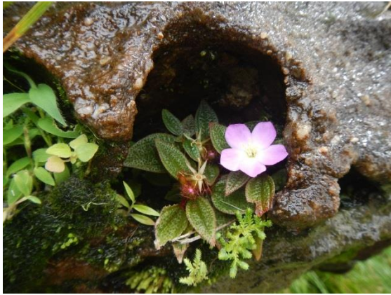
Heterotis pygmaea (A.Chev. & Jacq.-Fél.) Jacq.-Fél.