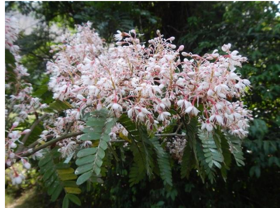
Talbotiella cheekii Burgt © Xander van der Burgt