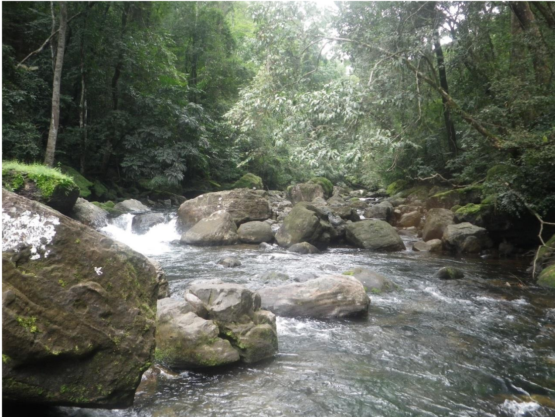
Forêt de Gbélén