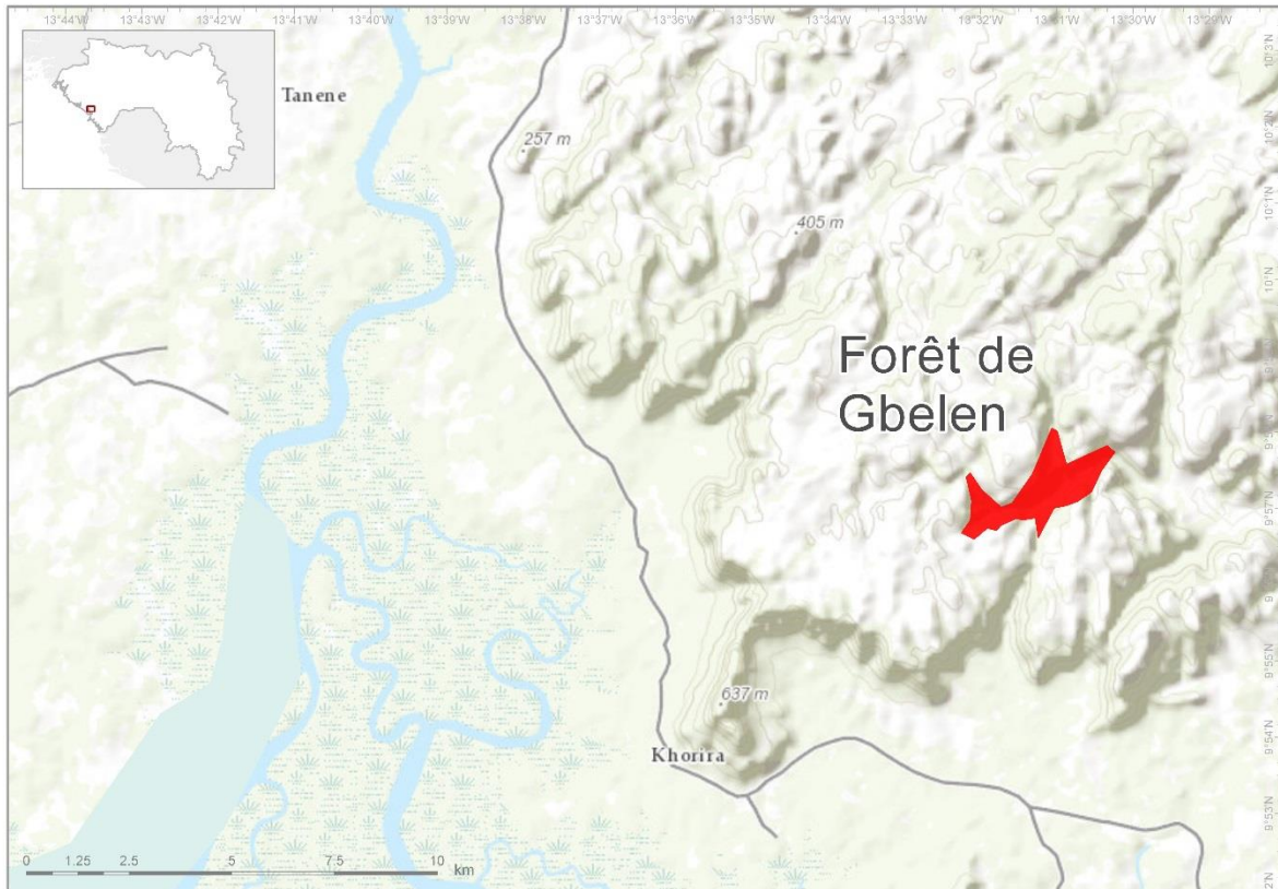
Carte montrant la zone proposée pour la protection des ZTIP.